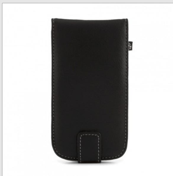
Étui en Simili Cuir - €29,95