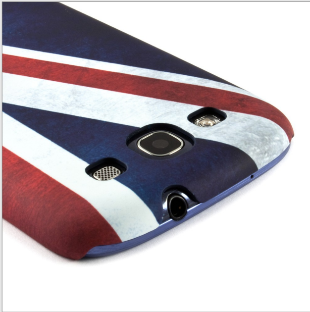
Coque Rigide Arrière Union Jack - €17,95