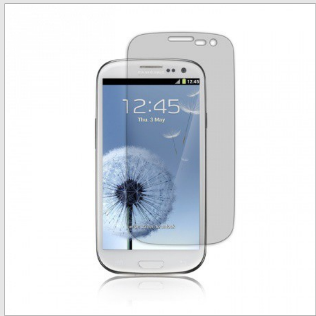
Protecteur d'écran Transparent - €5,95