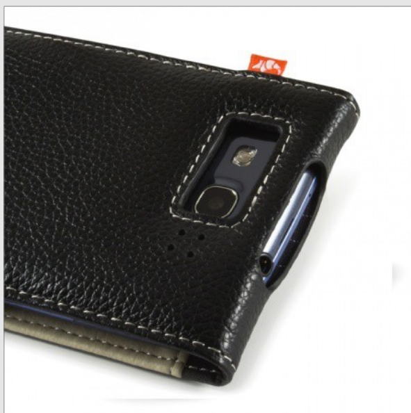
Étui en Cuir et Aluminium - €34,95

Ces étuis sont déjà disponibles en pré-commande et ils incluent un protecteur d'écran gratuit en offre limité.