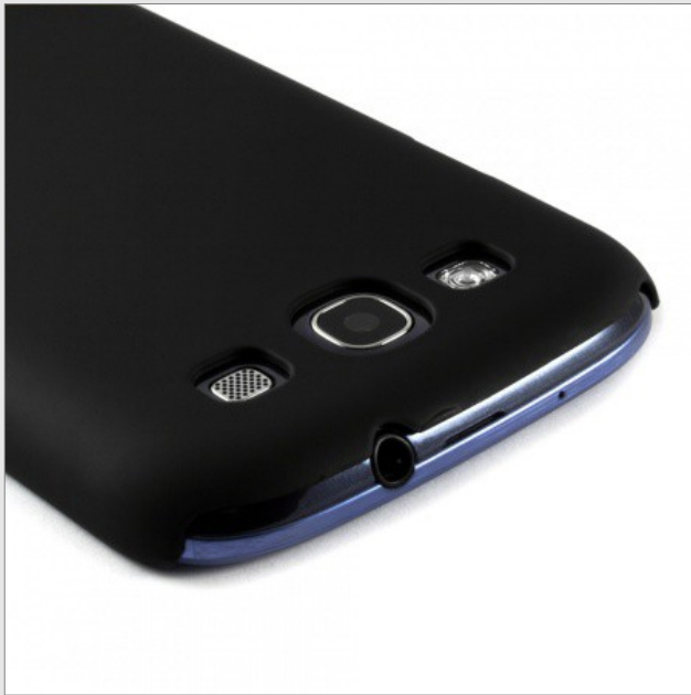
Coque arrière Quiksilver - 'Noire' - €23,95