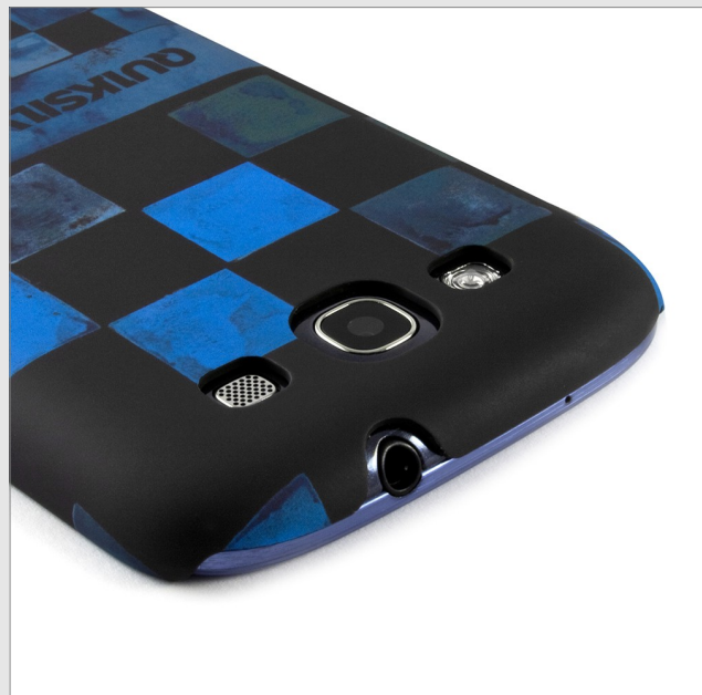
Coque Quiksilver 'Échecs en Bleu' - €23,95