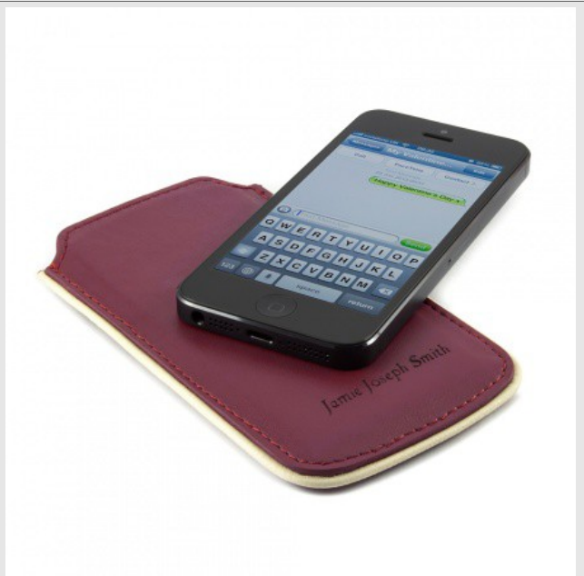
Housse Pochette pour iPhone 5 – Rose – Personnalisée