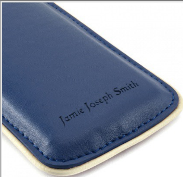
Housse Pochette pour iPhone 5 – Bleu - Personnalisée

La gravure du message est complètement gratuite et elle est disponible pour les housses pochettes pour iPhone 5 en bleu et en rose, pour les étuis pour iPad 3 et 4 en noir et marron, et pour les étuis pour Kindle de la collection BRUNSWICK ENGLAND.